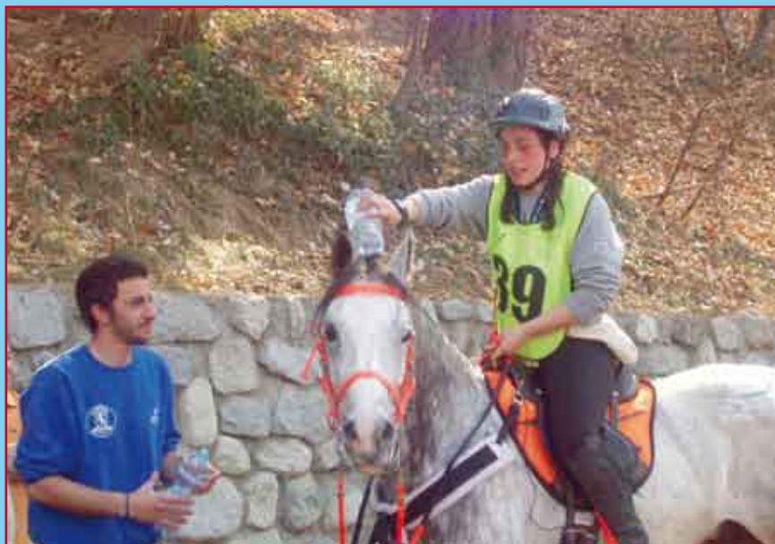
P6 Marrama x C&amp;N